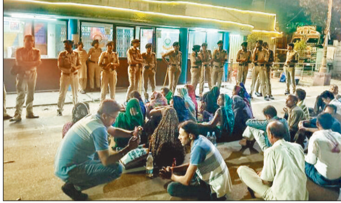
हरिभूमि न्यूज | रायगढ़

देखा वह विचलित हो गया, लेकिन पुलिस वालों का दिल नहीं पसीजा। करीब 20 घंटे तक मासूम अपने मां, दादी और अन्य ग्रामीणों के साथ धरने पर बैठा रहा। बाद में पांच लोगों को चर्चा करने के लिए एसएसपी ने बुलाया तो था, लेकिन इसका परिणाम एक मासूम भी अपने पिता को छुड़ाने को तयार रोड थाने के सामने धरने पर चिलचिलाती धूप में बैठा रहा। इस नजारे को जिसने भी