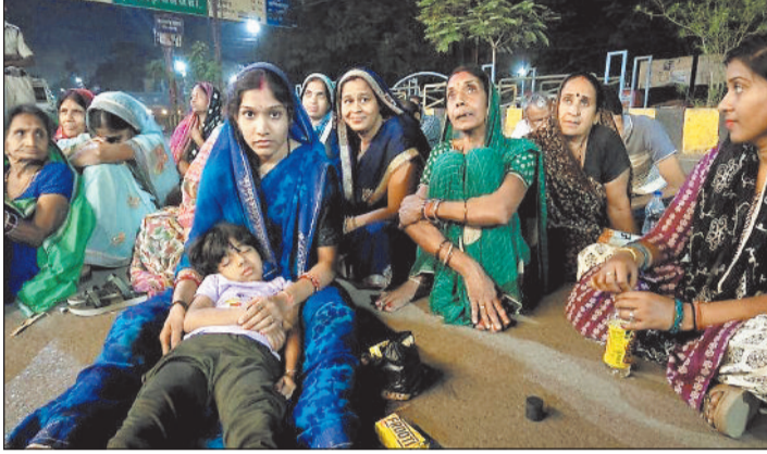
हरिभूमि न्यूज | रायगढ़

गेजामुड़ा के ग्रामीणों के साथ शनिवार-रविवार को जो प्रशासनिक आतंक का नजारा देखने को मिला वह किसी हिटलरशाही से कम नहीं था। एक पिता को पांच लोगों को चर्चा करने के लिए एसएसपी ने बुलाया तो था, लेकिन इसका परिणाम एक मासूम भी अपने पिता को छुड़ाने को तयार रोड थाने के सामने धरने पर चिलचिलाती धूप में बैठा रहा। इस नजारे को जिसने भी